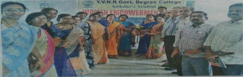
పోటీల నిర్వహణకు సిద్ధమైన ఎంపవర్ సెల్ సభ్యులు