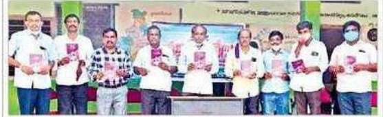
విస్మయపేట: జిఎచ్ ముద్రించిన పుస్తకాన్ని ఆవిష్కరిస్తున్న ఉపాధ్యాయులు