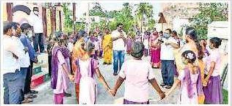
మండవల్లి: మానవహారం నిర్వహించిన బాలికలు, అధికారులు